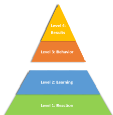
The Kirkpatrick Model